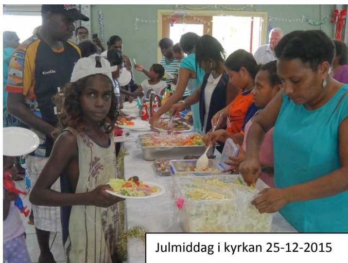
Julmiddag i kyrkan 25-12-2015