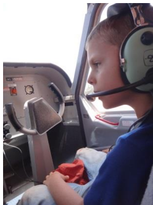
Ovan: Pilot och co-pilot på väg till Bukudal hemort. Nedan: en av våra närmaste stränder, 7 min bilväg från vårt hus.