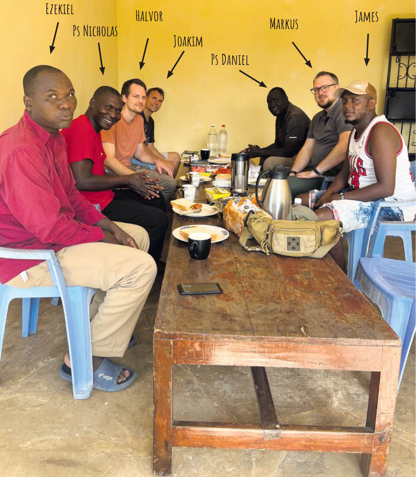
Frukostbordet ved Liberty center i Ukunda.