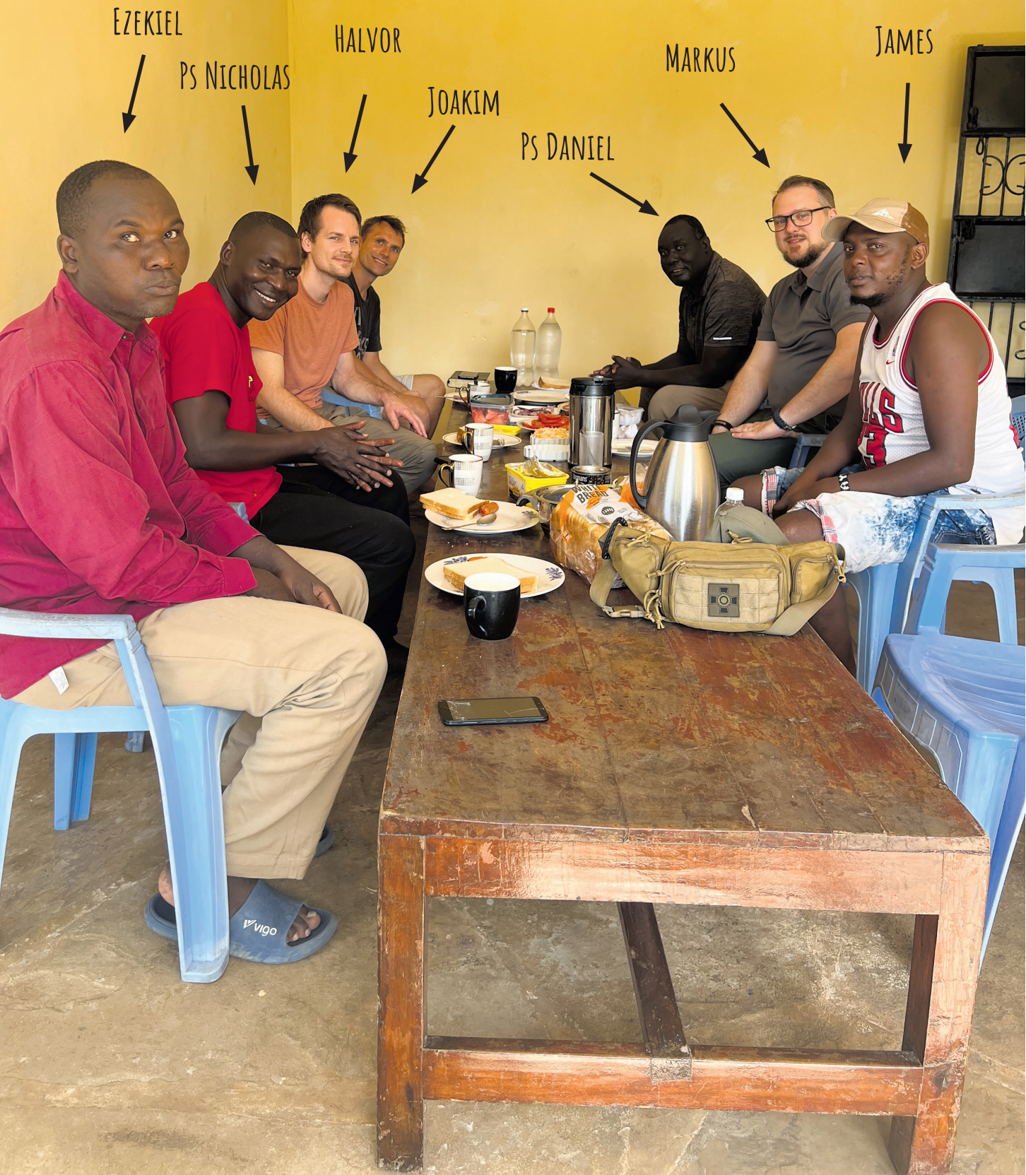
Frukostbordet ved Liberty center i Ukunda.